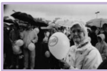
El espíritu de las Campañas Contra Pornografía (CCP) sigue fuerte aún en la lluvia.