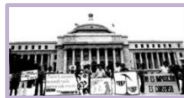
Los puertorriqueños oponen la pornografía fuertemente en los años noventa.